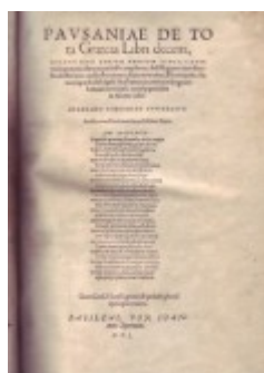
n. 293: Pausanias