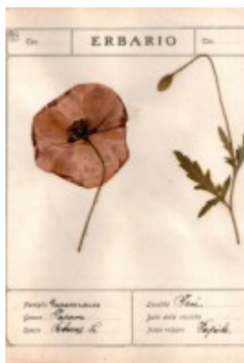
n. 46: Erbario 1926