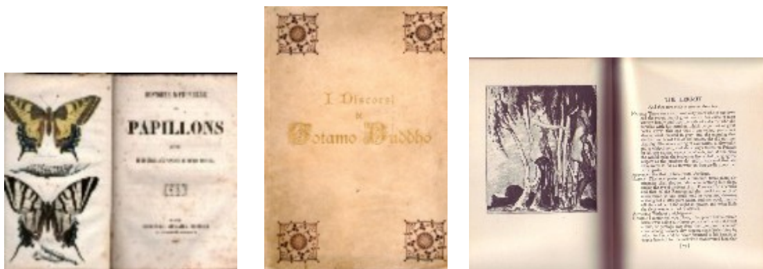
n. 131: Constant