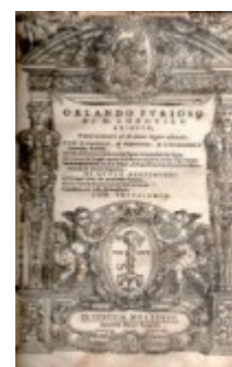
n. 60: Ariosto

242. (Giurisprudenza) Manunzio Paolo. ANTIQUITATVM ROMANARVM PAULI MANVTII LIBER DE LEGIBVS. INDEX RERVM MEMORABILIVM. Venetiis, Aldus, 1559.