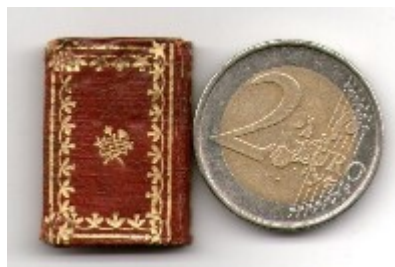
n. 49: Le Joyeux Troubadour