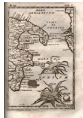
n. 66: Baglivi

47. (Magia - Giochi) Anonimo. IL LIBRO DEI GIUOCHI. Prestidigitazione, magia, giuochi di abilit , di calcolo, d'azzardo e di conversazione.. Milano, Salani, 1932.