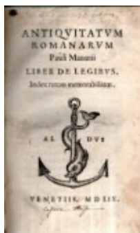
n. 242: Manunzio