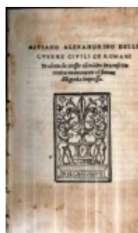
n. 58: Appiano